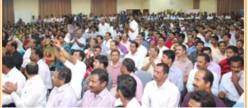
മുസഫ ബ്രദറൺ ചർച്ച് സെന്ററിൽ നടന്ന സംഗീതോത്സവത്തിൽ നിന്ന്.