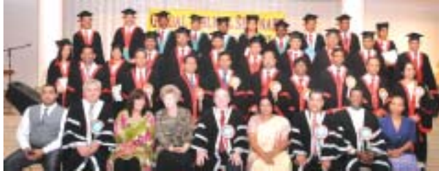
ഷാർജാ ഗിൽഗാൽ ബിബ്ലിക്കൽ സെമിനാരിയിൽ പഠനം പൂർത്തിയാക്കിയ വിദ്യാർത്ഥികൾ ബിരുദദാനച്ചടങ്ങിൽ വിശിഷ്ടാതിഥികളോടൊപ്പം.

മതങ്ങൾ തമ്മിലുള്ള സംഘർഷങ്ങളെയും ഈജിപ്തിൽ കോപ്റ്റിക് ക്രൈസ്തവർക്കുനേര നടക്കുന്ന അക്രമങ്ങളെയും പോപ്പ് അപലപിച്ചു.