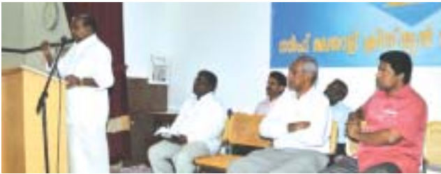
ഷാർജ യൂണിയൻ ചർച്ചിൽ ഗൾഫ് മലയാളി ക്രിസ്ത്യൻ റൈറ്റേഴ്സ് ഫോറം സംഘടിപ്പിച്ച സത്യവേദപുസ്തക ശതാബ്ദി സമ്മേളനത്തിൽ പെരുമ്പടവം ശ്രീധരൻ മുഖ്യപ്രഭാഷണം നടത്തുന്നു.

ഷാർജ: മനുഷ്യൻ ക്രിസ്തുവിൽ നിന്നു അകലുന്ന താണു ഇന്നു ലോകം നേരിടുന്ന ദുരവസ്ഥയ്ക്ക് കാരണം എന്ന് പ്രശസ്ത സാഹിത്യകാരൻ പെരുമ്പടവം ശ്രീധരൻ അഭിപ്രായപ്പെട്ടു. സ്നേഹത്തിന്റെ മറ്റൊരു പേരാണ് ക്രിസ്തു. ഷാർജ യൂണിയൻ ചർച്ചിൽ ഗൾഫ് മലയാളി ക്രിസ്ത്യൻ റൈറ്റേഴ്സ് ഫോറത്തിന്റെ ആഭിമുഖ്യത്തിൽ സംഘടിപ്പിച്ച സത്യവേദപുസ്തക ശതാബ്ദി സമ്മേളനത്തിൽ സംസാരിക്കുകയായിരുന്നു അദ്ദേഹം.